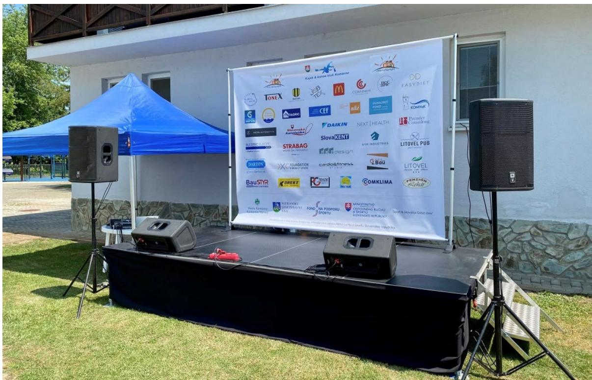
2. Banner so sponzormi umiestnený na pódiu

Kajak & kanoe klub Komárno, o.z. Župná 18 945 01 Komárno, Slovensko E-mail: kajakkomarno@gmail.com Mobil.: +421 915 178 155 IČO: 00609153 DIČ: 2021027283 IBAN: SK38 0200 0000 0000 1043 7142