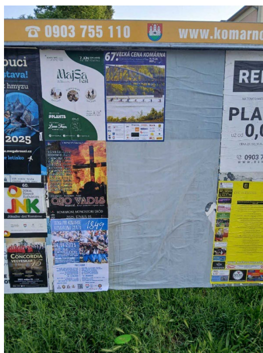
3. Plagát umiestnený v meste Komárno pred podujatím